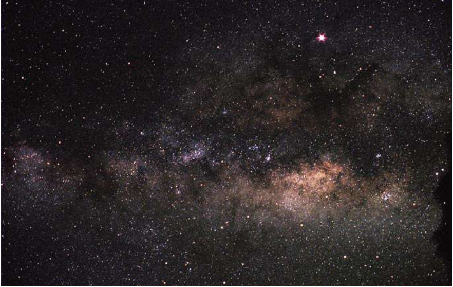
Imagen de los Cielos de La Palma tomada el 20 de Abril de 2007, la misma noche en que fue adoptada la Declaración.