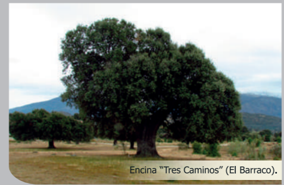
Encina "Tres Caminos" (El Barraco).

Se vuelve por el mismo camino de la anterior etapa y se toma el sendero PR-AV 33 que atraviesa el Monte El Encinar. Más adelante se cruza la carretera N-403 y se enlaza con el sendero GR 10.3 ("Camino de Valdelatas" y "Camino del Macho"). Se desciende hasta cruzar el Puente de Remajarina, sobre el río Gaznata. A continuación, se bordea la margen izquierda del Embalse del Burguillo, hasta que se toma una pista de tierra que asciende hasta la Urbanización "Arroyo de la Parra". A continuación se enlaza con el Mirador de la Gaznata y desciende hasta el camino de la cantera. Por último, la ruta conecta con la antigua carretera N-403 y sigue, por el Embalse del Charco del Cura, el mismo trazado de la etapa 1 hasta la localidad de El Tiemblo.