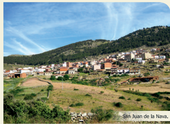
San Juan de la Nava.

Se inicia en Navalunga por la calle El Sestil. El primer tramo corresponde a una pista de tierra en buen estado que discurre entre muros de piedra seca ("Camino de El Barraco a Navalunga"), y asciende de forma constante por relieves alomados y fracturados. Existen dos posibilidades, la primera nos lleva hasta San Juan de la Nava por el llamado "Camino del Chorro" y desde esta localidad a El Barraco por el sendero GR 10.3. La segunda opción atraviesa el Monte El Encinar, enlazando con el Cerro Morrucco (PR-AV 34), hasta la localidad de El Barraco, final de la etapa.