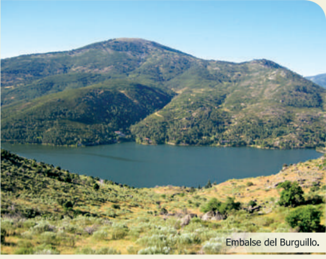
Embalse del Burguillo.

La ruta se inicia en la localidad de El Tiemblo. Se toma la calle cementada que desciende hasta la presa del Embalse del Charco del Cura. Más adelante, el itinerario aprovecha una senda por la margen izquierda del embalse, para enlazar con el sendero GR 10. Por la antigua carretera N-403 se atraviesa la presa del Embalse del Burguillo. El último tramo se realiza por la pista asfaltada (GR 10) que lleva hasta Las Cruceas (Casa del Parque de la Reserva Natural del Valle de Iruelas) o bien hasta el camping, final de la primera etapa.