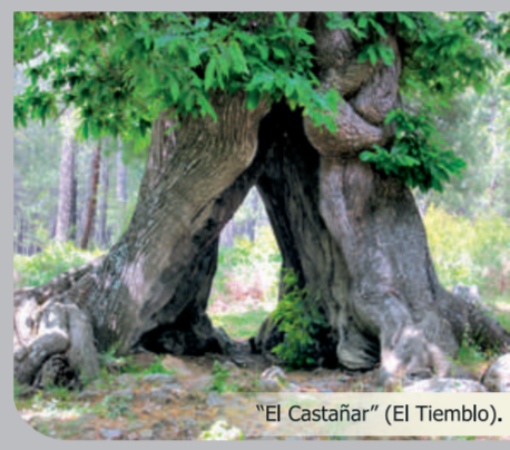
"El Castañar" (El Tiemblo).

Exigente etapa de gran longitud y desnivel, recomendada solamente para senderistas habituados a la montaña y de gran condición física. Desde la localidad de El Tiemblo (C/Maestro Zarate) la etapa discurre por la pista asfaltada en dirección a El Castañar (3,5 km). Se toma la "Senda de San Gregorio" (PR-AV 52) hasta el área recreativa "El Regajo". Posteriormente, por la senda de "El Castañar" (PR-AV 54) se enlaza con el área recreativa "Las Barrancas" y en fuerte pendiente se alcanza el Pozo de la Nieve y Puerto Casillas (PR-AV 21), mirador privilegiado de la Reserva Natural del Valle de Iruelas. Por último, se desciende por la pista forestal principal del fondo de la Garganta, bien hasta la Casa del Parque (Las Cruceas) o bien hasta el camping Valle de Iruelas.